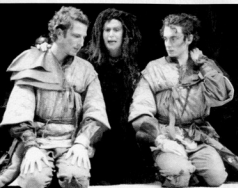
Cléopâtre osera-t-elle sacrifier l'un de ses fils pour conserver le pouvoir ? Réponse dans "Rodogune"